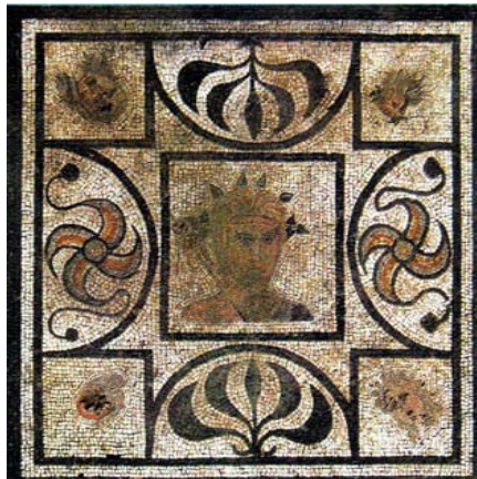
Dalle de la villa de GOIFFIEUX

Plus particulièrement ; les Amis du Vieux Mornant animeront deux manifestations : Le voyage à Arles le 14 juin et l'exposition à la Maison de Pays.