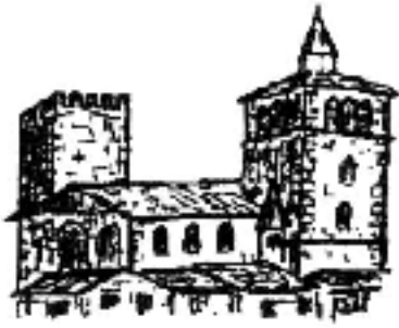
Tour du Vingtain